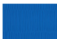
Vinile colore Blu