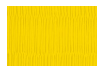
Vinile colore Giallo