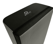
Dettaglio parte inferiore