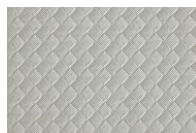
Tessuto Btex® Silver